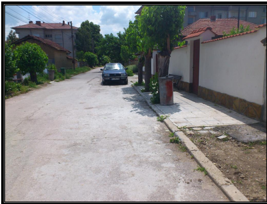
Ул.Антим I в посока от ОК 132А към пл.Славейков