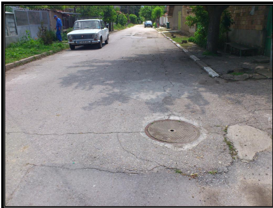
Началото на ул. „Антим I ”