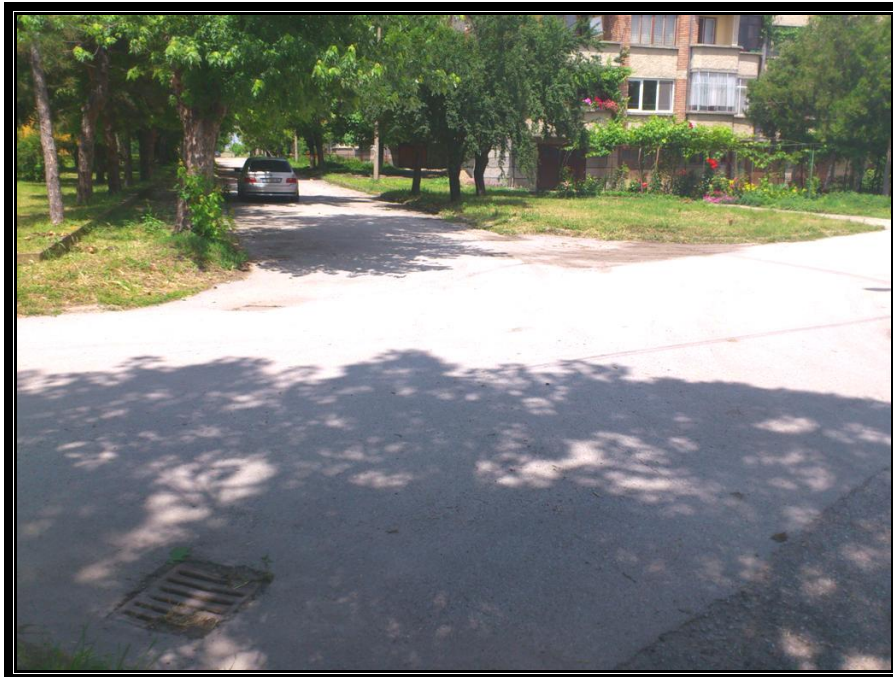
Кръстовище с ул. "В. Търново"