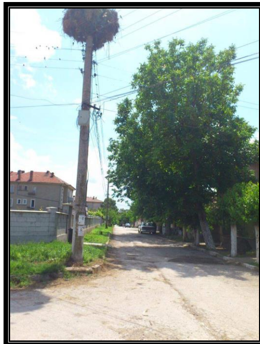
Кръстовище с ул. "Изворова" – ОК 132А