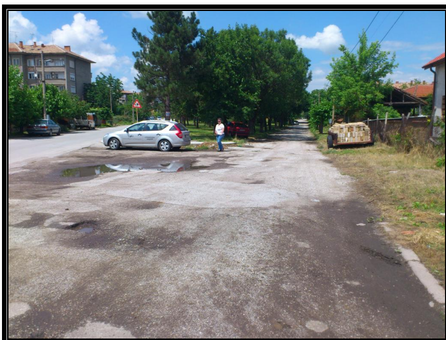
Кръстовище ОК192 в посока към ул. "Клокотница" и пл. "Славейков"