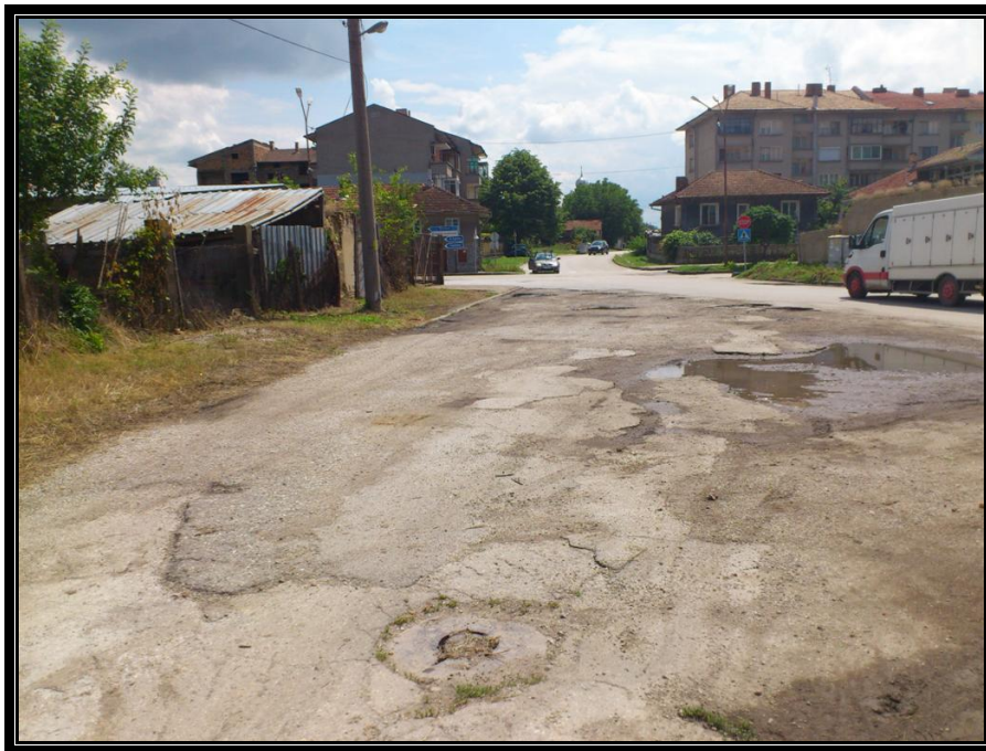
Кръстовище ОК192 в посока към ул. "Янтра"