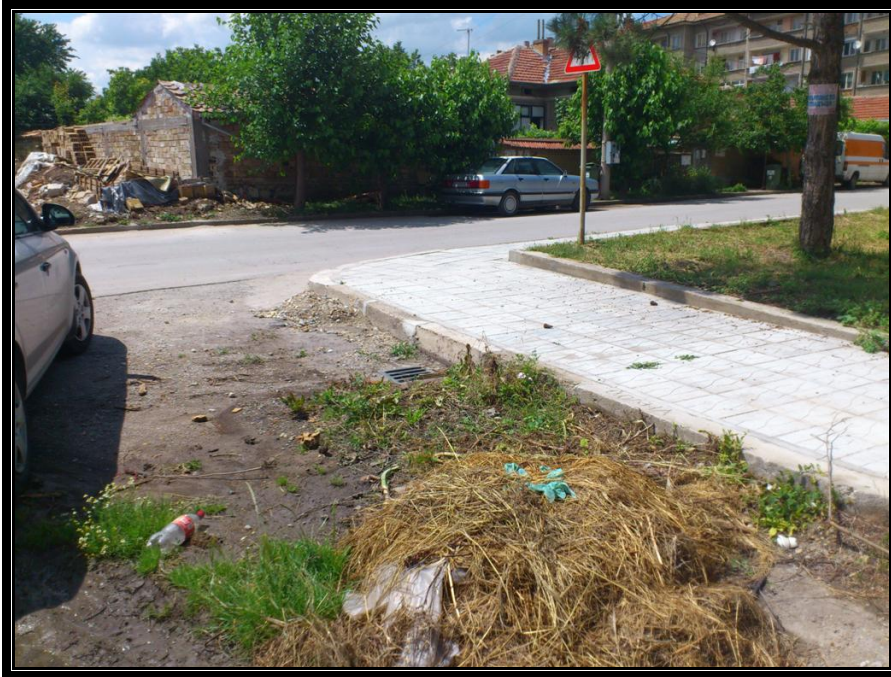
Тротоар между ул. "Клокотница" и пл. "Славейков"